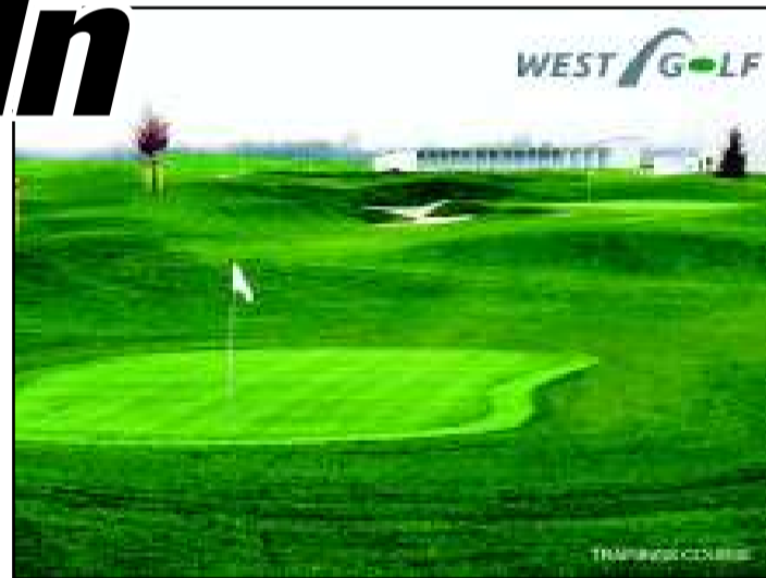
Golfen wie die Profis: Auf der Anlage von PGA-Tour-Star Craig West findet jeder das richtige Handycap.

WEST GOLF 6. + 7. Juni 09 11:00 - 17:00 Uhr TAG DER OFFENEN TÜR Golf für Jedermann auf Europas innovativster öffentlicher Golfanlage!